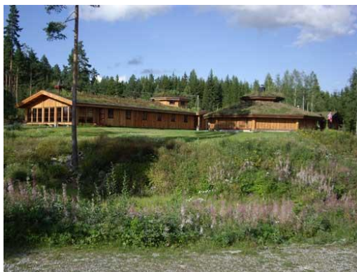
Kano kan leies på Nes Villmarksforum

Du kan følge stien rundt sjøen fra Sjøheim, eller fra Nes Villmarksforum.